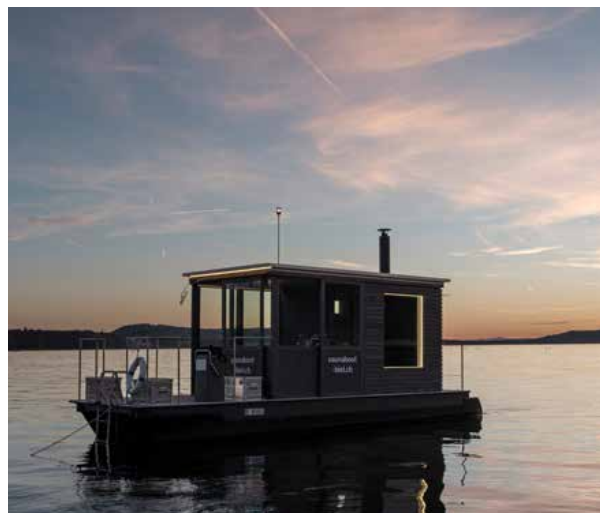
↗ Sur le lac de Bienne, un bateau dont la cabine est aménagée en sauna peut être loué pour la demi-journée à partir de deux personnes.