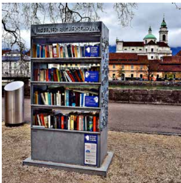
Der offene Bücherschrank beispielsweise in Solothurn wird rege genutzt

Da die Stadt einen Offenen Bücherschrank grundsätzlich als kulturelle Bereicherung für Baden einstuft, und der Prozess noch nicht weiter vorangeschritten ist, haben wir in Zusammenarbeit mit dem Verein «Offener Bücherschrank» eine ergänzende Anfrage mit unserem Wunschstandort Kurpark eingereicht. Sollten wir von Seiten der Stadt einen positiven Entscheid erhalten, so könnte mit der Planung und vor allem mit der Beschaffung der finanziellen Mittel begonnen werden. Dabei wird der Römerquartierverein auf Spenden angewiesen sein.