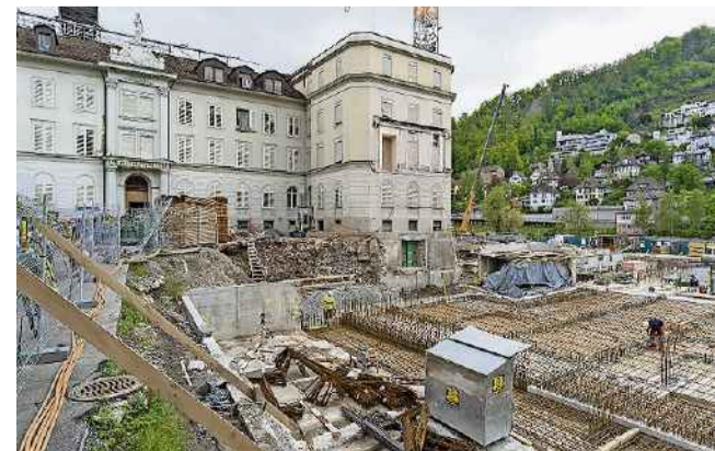
In den Bädern entsteht das neue Thermalbad.