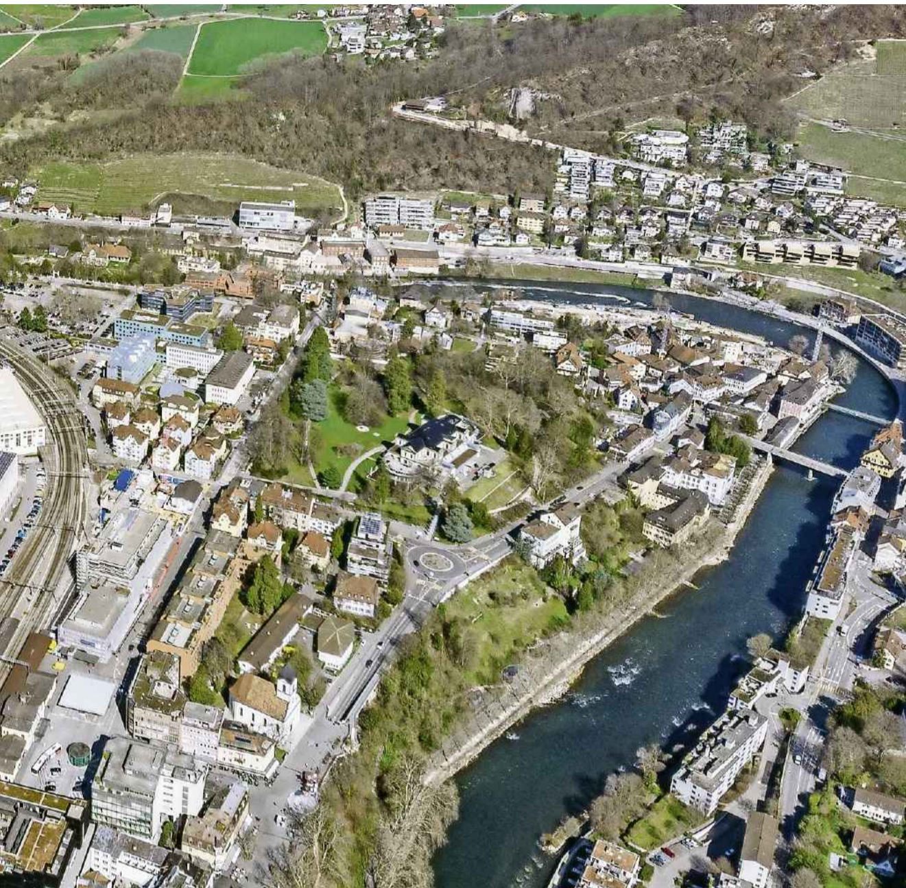
... Gut zu sehen sind unter anderem der Kurpark, der Bahnhof und die Bäder am Limmatknie.