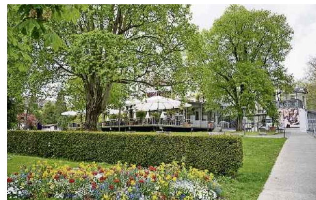
Der Kurpark zeigt im Frühling seine Blütenpracht.