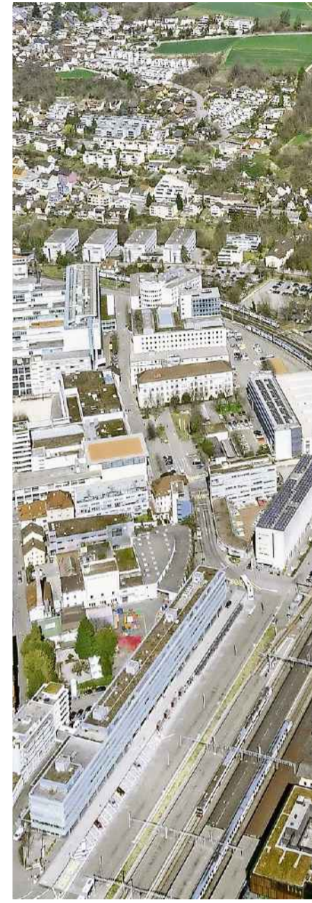
Das Römerquartier aus der Vogelperspektive

Unser Rundgang endet auf dem unteren Bahnhofplatz beim Springbrunnen. Ob in der Mittagspause, nach Feierabend oder während des «Winterzaubers»: Der untere Bahnhofplatz ist ein weiterer Ort im Römerquartier, an dem sich Jung und Alt treffen, Quartierbewohner und Auswärtige.