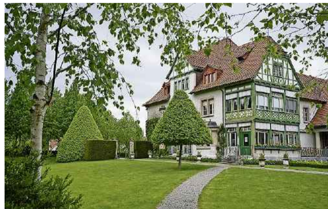
Die Villa Langmatt und die Parkanlage.