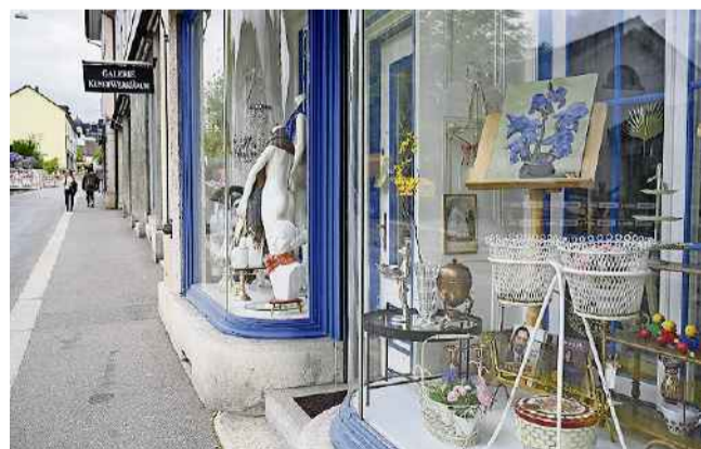
Die Bäderstrasse: Die «Lädeli-Meile» des Römerquartiers.