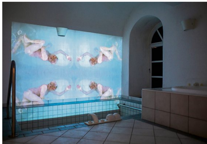
Installation des Künstlerinnenduos Bigler-Weibel in einer Badezelle.