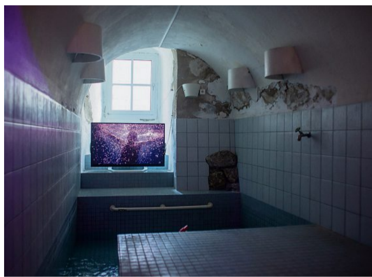
Hier nagte der Zahn der Zeit: Der Umbau soll 1,3 Millionen Franken kosten.